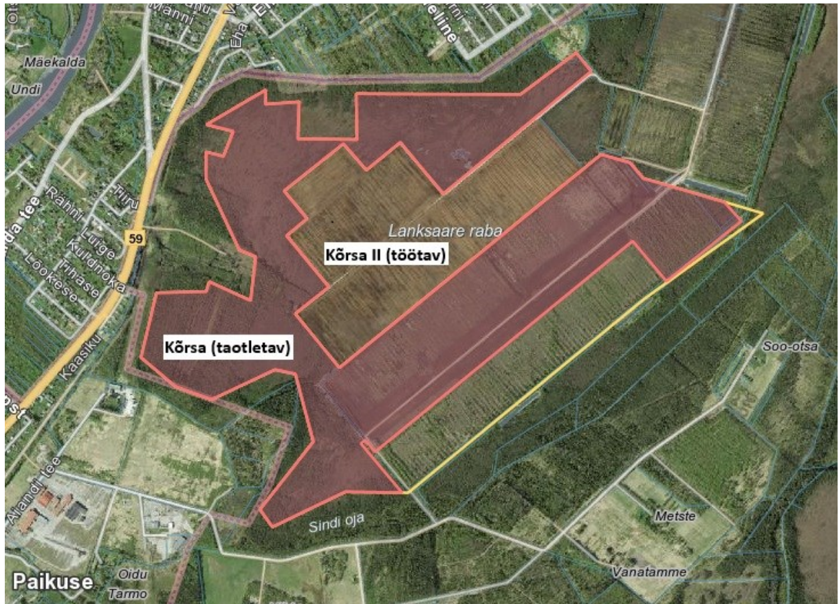
Joonis 1 Kõrsa taotletav turbatootmisala (keskel töötav Kõrsa II turbatootmisala).

KMH viiakse läbi keskkonnaloa (tegevusloa) andmise üle otsuse tegemiseks, sh loatingimuste määramiseks. KMH käigus hinnatakse planeeritava tegevuse ja selle reaalsete alternatiivsete võimaluste otseseid ning kaudseid olulisi mõjusid keskkonnameetmetele, inimese tervisele, heaolule ja varale. KMH käigus töötatakse välja keskkonnameetmed olulise keskkonnamõju vältimiseks või vähendamiseks. Keskkonnamõju hindab KMH juhtekspert ja eksperdirühm koos arendajaga.